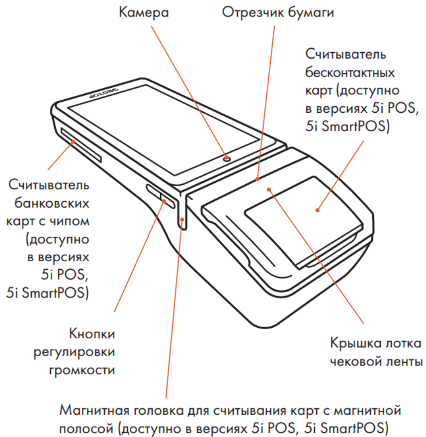
Смарт-терминал «Эвотор 5line». Вид сзади и сбоку